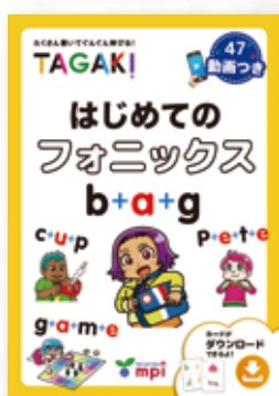
『はじめてのフォニックス TAGAKI』 発行元：株式会社 mpi 松香フォニックス