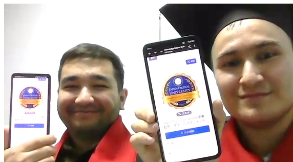
発行されたJDUの卒業デジタルバッジ